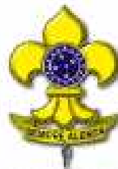
Flor-de-Lis Símbolo da UEB

A União dos Escoteiros do Brasil - UEB, fundada em 04/11/1924, é uma sociedade civil de âmbito nacional, de direito privado e sem fins lucrativos, de caráter educacional, cultural, beneficente e filantrópico, reconhecida de utilidade pública, que congrega todos quantos pratiquem o Escotismo no Brasil, (Estatuto da UEB -Art 1o )